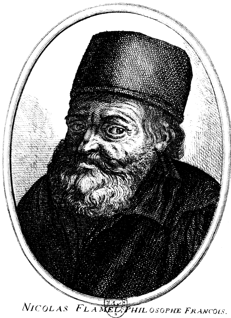
NICOLAS FLAMEL, PHILOSOPHE FRANCOIS.